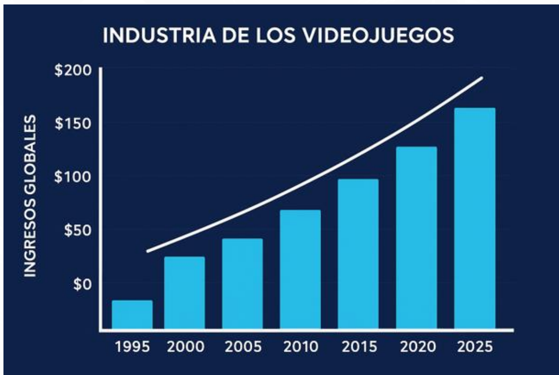
Figura 3. Crecimiento económico de los eSports

Crecimiento económico del Gaming de 1995 a 2025.